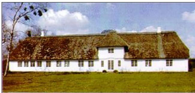
Darum Præstegård- ældste beboelse i Darum