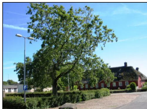
Kvinde Eg i Darum. Plantet 1915 til ære for at kvinder fik valgret.