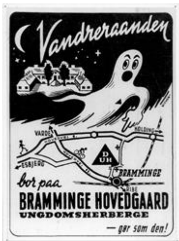
Kort fra Poul Lunds vandrehjem.